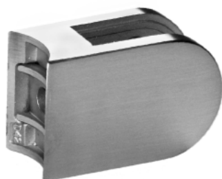
Glashalter Zink-Druckguss und Edelstahl finish (Effekt) auf Anfrage.