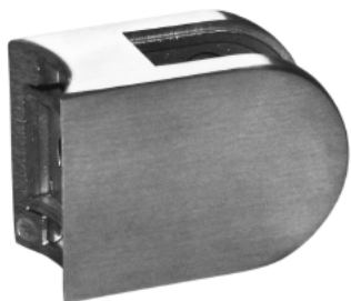
Glashalter V2 A auf Anfrage