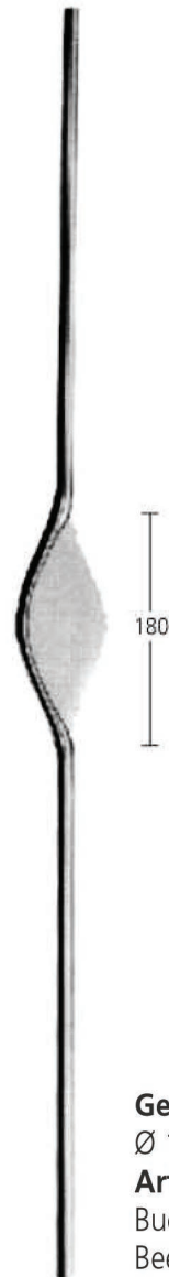
Geländerstab Ø 14 mm Art. 9.05.0510 Buche lackiert Beech varnished