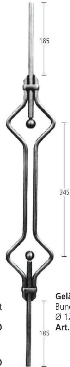
Geländerstab Bund Edelstahl Ø 12 mm Art. 9.05.0260