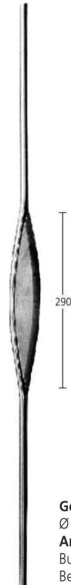
Geländerstab Ø 14 mm Art. 9.05.0500 Buche lackiert Beech varnished