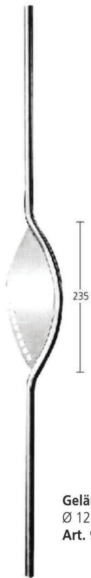
Geländerstab Ø 12 mm Art. 9.05.0310

Geländerstäbe, Länge 950 mm, Vollmaterial · Bars – railing systems, 950 mm long, solid material