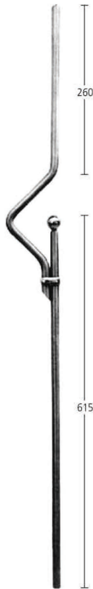
Geländerstab Bund vergoldet Ø 14 mm Art. 9.05.0200 Bund Edelstahl Ø 12 mm Art. 9.05.0280